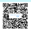
Weitere Informationen RKI