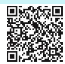
Weitere Informationen BZgA