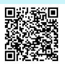
Corona-Regelungen in den Bundesländern