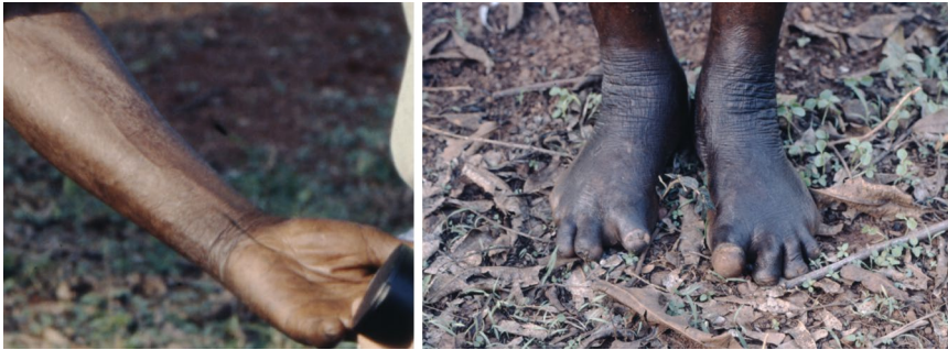
Abb. 1 ▲ Linker Arm und Füße eines Leprapatienten aus Kongo-Kinshasa. Links: Unterarm mit Verdickung des N medianus . Rechts: Verstümmelte Zehen und pergamentartige Haut im Bereich der Unterschenkel