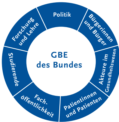
Abbildung 1 Adressaten der Gesundheitsberichterstattung des Bundes

Die Politik ist ein wichtiger, aber nicht der einzige Adressat der GBE des Bundes (Abbildung 1). Ebenso richtet sie sich an wissenschaftliche Expertinnen und Experten und liefert Basisinformationen und Referenzen für die epidemiologische und die Public Health-Forschung, die auch für Studierende und Lehrende dieser Fächer von Bedeutung sind. Angesprochen wird außerdem die Fachöffentlichkeit, einschließlich Journalistinnen und Journalisten, die sich für Beiträge zu gesundheitsbezogenen Themen auf wissenschaftliche Fakten stützen möchten. Zu den Zielgruppen gehören ferner die Gesundheitsämter, Krankenkassen, Wohlfahrtsverbände, Selbsthilfeorganisationen und andere gesellschaftliche Akteure, die für ihre Arbeit auf aktuelle Daten und Informationen zur Gesundheit angewiesen sind. Nicht zuletzt soll den Bürgerinnen und Bürgern ein einfacher und direkter Zugang zu wissenschaftlich fundierten Gesundheitsinformationen eröffnet werden.